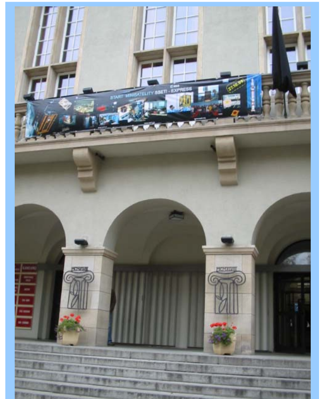
Jeden z banerów wykonanych na zamówienie Politechniki Wrocławskiej.