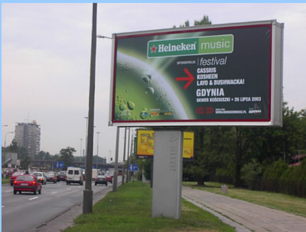
baner backlit w ciągu dnia