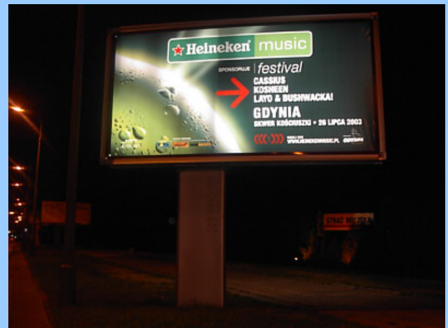
baner backlit w nocy