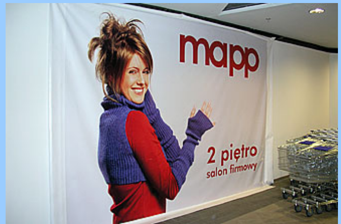
przykłady zastosowań banerów typu frontlit